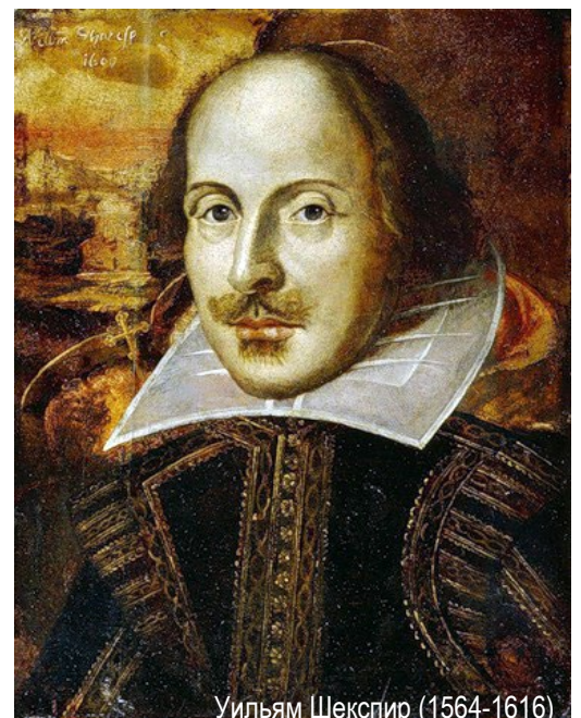
Уильям Шекспир (1564-1616)