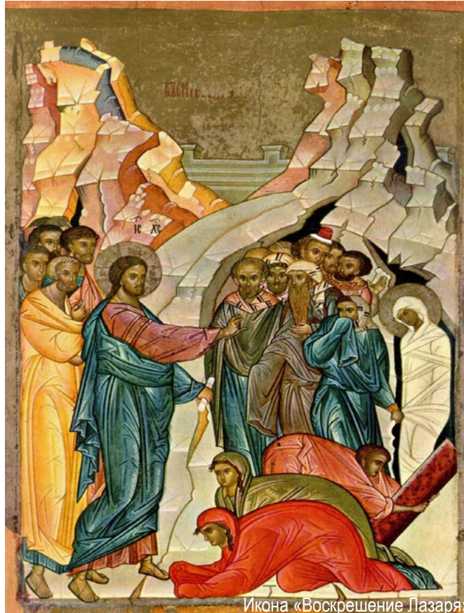
Икона «Воскрешение Лазаря»

Мы исполним две кантаты – «Из Гомера» Римского-Корсакова и «Иоанн Дамаскин» Танеева. К сочинению Римского-Корсакова я обращаюсь впервые. Эта небольшая вокально-симфоническая зарисовка для солистов, хора и оркестра замышлялась композитором как пролог к опере «Навизкая» на сюжет из «Одиссеи». Опера так и не была написана, но произведение обрело самостоятельную жизнь. Партитура сопровождается программным пояснением, в основе которого – строки из поэмы Гомера. Они повествуют о странствиях Одиссея, описывают морские пейзажи, бурю, кораблекрушение и чудесное спасение главного героя. Музыка настолько красочная и театральная, что можно закрыть глаза и вообразить море, набегающие друг на друга волны и корабль. Не в силах противостоять стихии, он разбивается о скалы и гибнет. Затем море успокаивается, наступает штиль, и восходит алая заря. В этот момент всту-